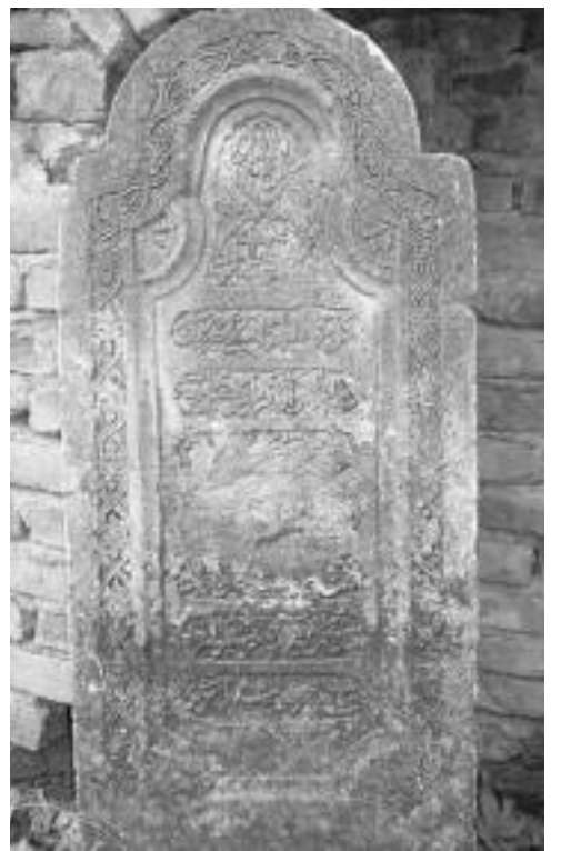
Səadət bəyimin başdaşısının bir hissəsi